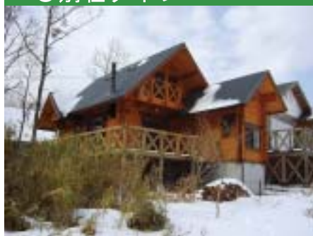
S 様邸 (大分県由布市) 延べ床面積 21.6坪 ロフト付