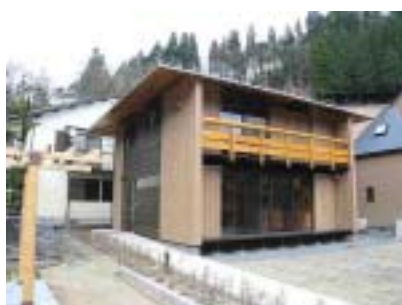
▲大分県中津江村 村営住宅

参考施工価格 790万円 ※仮設・基礎・木・ログ・屋根・建具・塗装・建材・電気配線・給排水設備工事を含む。