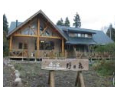
▲大分県湯布院町 森の宿「野乃花」