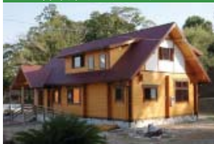
子育て支援施設 (熊本県玉名市) 延べ床面積 44坪 ロフト付