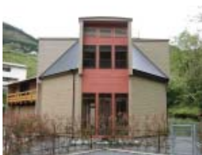
▲大分県中津江村 村営住宅