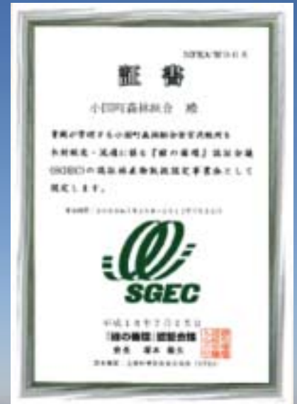
「緑の循環」認証会議 証書