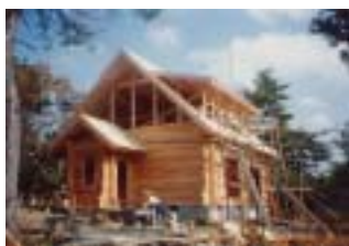
小国杉の角ログを丁寧に組上げていく