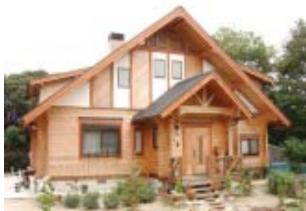
I 様邸 (福岡県糸島郡) 延べ床面積 57坪 ロフト付